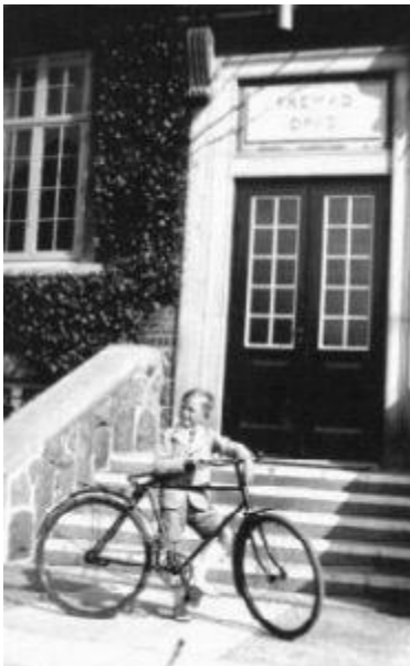
Skolevej 1941

Den nuværende skole blev indviet den 6. januar 1944.