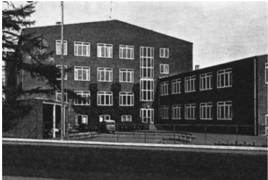
Baunegårdsvej 1965 kilde Din-Bog.dk